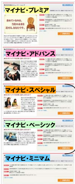
マイナビ転職 求人情報表示順位

上位企画順に求人情報を表示するマイナビ転職の特性上、上位企画ほど求職者からの発見度が高まります。マイナビ・スペシャルを、さらに上位の企画に上げて掲載する事により、前回以上の求人効果が期待できます。